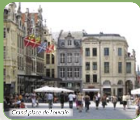
Grand place de Louvain