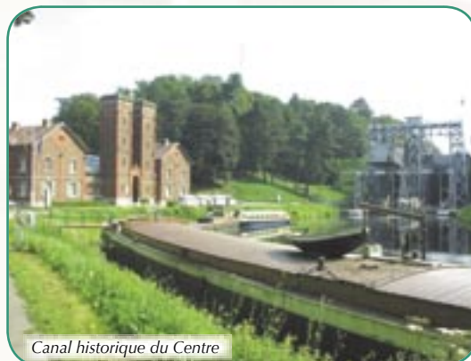
Canal historique du Centre