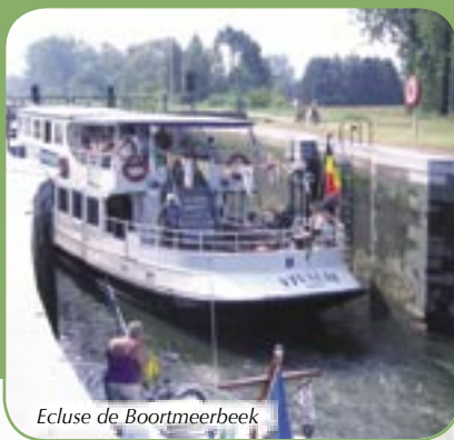
Ecluse de Boortmeerbeek