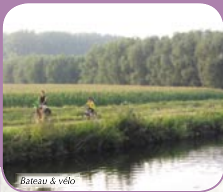
Bateau & vélo