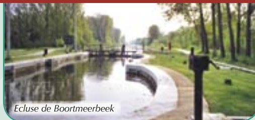
Ecluse de Boortmeerbeek