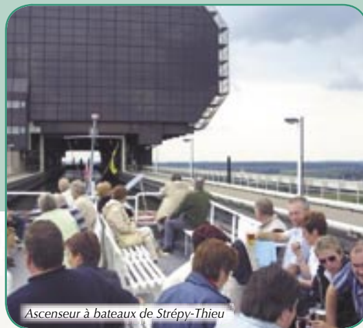
Ascenseur à bateaux de Strépy-Thieu

€ Ad.: € 19 - enf.: € 15 - enf.<3ans.: € 3