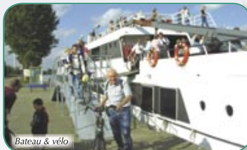
Bateau & vélo