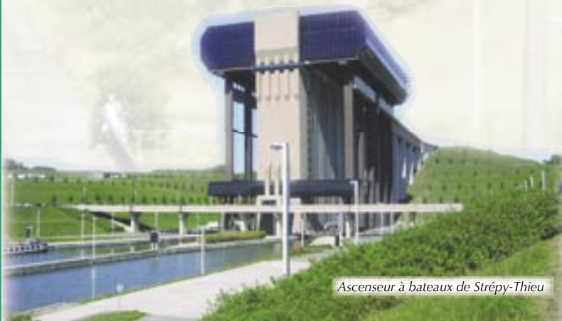
Ascenseur à bateaux de Strépy-Thieu