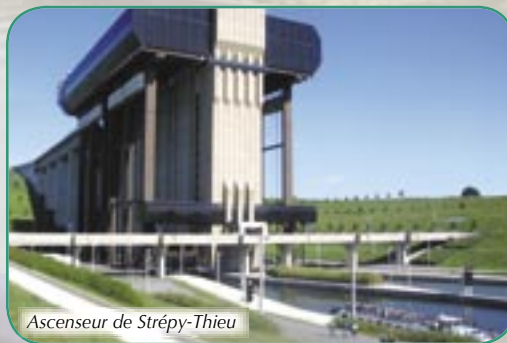
Ascenseur de Strépy-Thieu