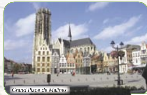
Grand Place de Malines

* Combinaison bateau-car ou bateau-train