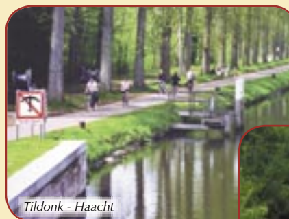
Tildonk - Haacht

€ Ad. € 6 - enf.: € 5 - vélo à bord: € 3