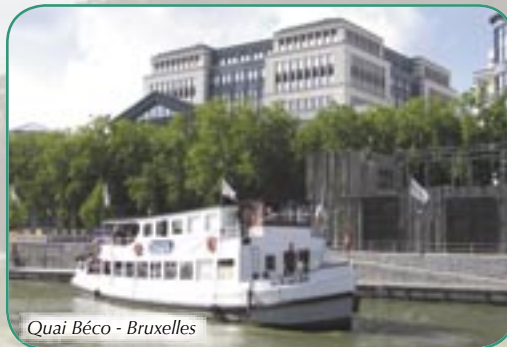
Quai Béco - Bruxelles