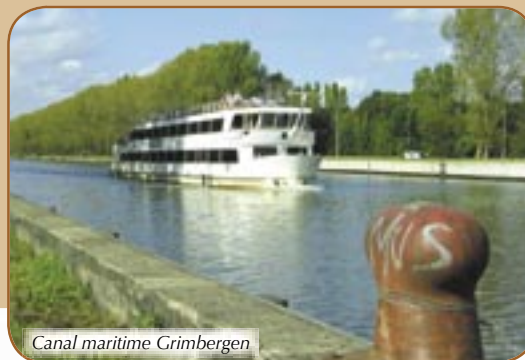
Canal maritime Grimbergen

€ Ad.: € 10 - enf.: € 8 - enf. <3ans.: gratuit