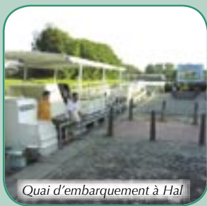
Quai d'embarquement à Hal

Lors des croisières vers les 'célèbres ascenseurs' les bateaux franchissent de manière spectaculaire des dénivellations énormes via des ouvrages d'art impressionnants: à Ittre 14 m, à Ronquières 67 m et à Strépy-Thieu 73 m. À certains endroits le nouveau canal du Centre domine les villages de la vallée comme un aqueduc: un spectacle à couper le souffle!