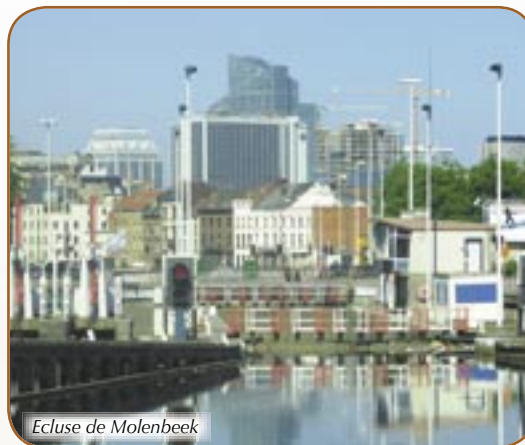
Ecluse de Molenbeek