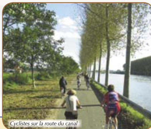
Cyclistes sur la route du canal

€ Ad.: € 6 - enf.: € 5 - enf. <3ans.: gratuit