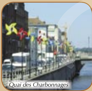
Quai des Charbonnages