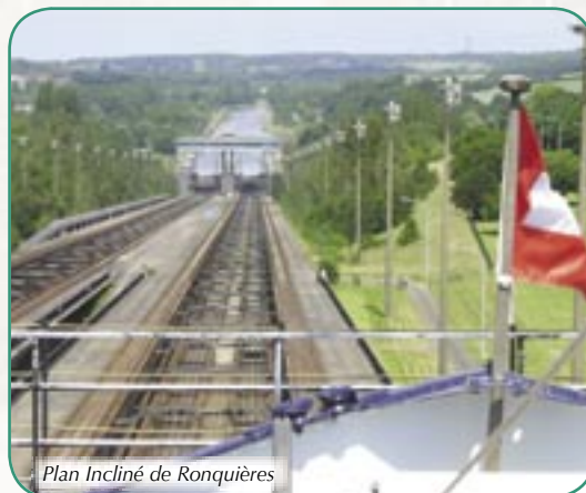
Plan Incliné de Ronquières