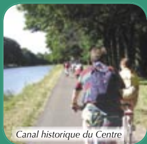
Canal historique du Centre

Lors des croisières vers les 'célèbres ascenseurs' les bateaux franchissent de manière spectaculaire des dénivellations énormes via des ouvrages d'art impressionnants: à Ittre 14 m, à Ronquières 67 m et à Strépy-Thieu 73 m. À certains endroits le nouveau canal du Centre domine les villages de la vallée comme un aqueduc: un spectacle à couper le souffle!