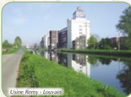
Usine Remy - Louvain

€ Ad.: € 6 - enf.: € 5 - enf.<3ans.: gratuit